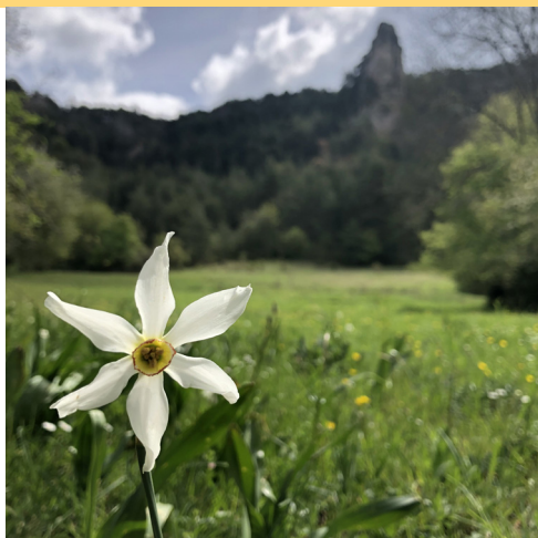
Narcisse des poètes

*Comité pour la mise en œuvre du plan agri-environnemental et de gestion de l'espace en Lozère.